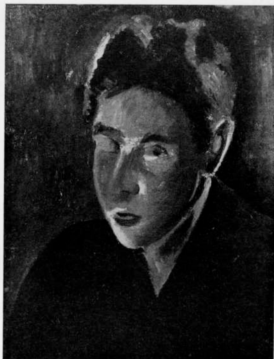
Giorgio Morandi « Autoritratto », 1914