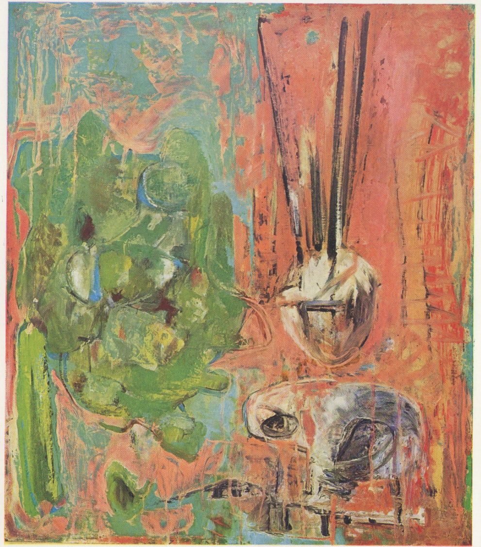
« Interno - Esterno » olio 1973 cm. 65 x 75