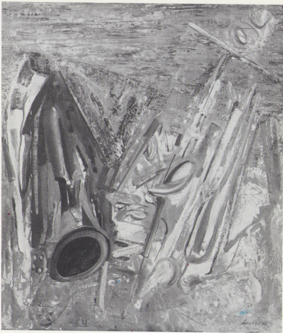
« Fuligine » olio 1972 cm. 70 x 80