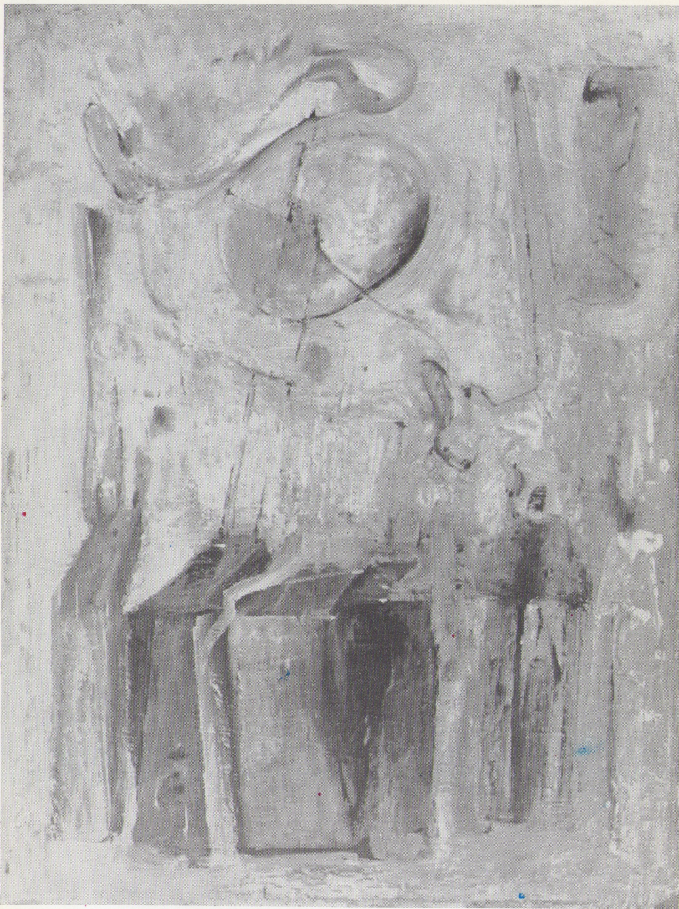
« Interno » olio 1973 cm. 70 x 85