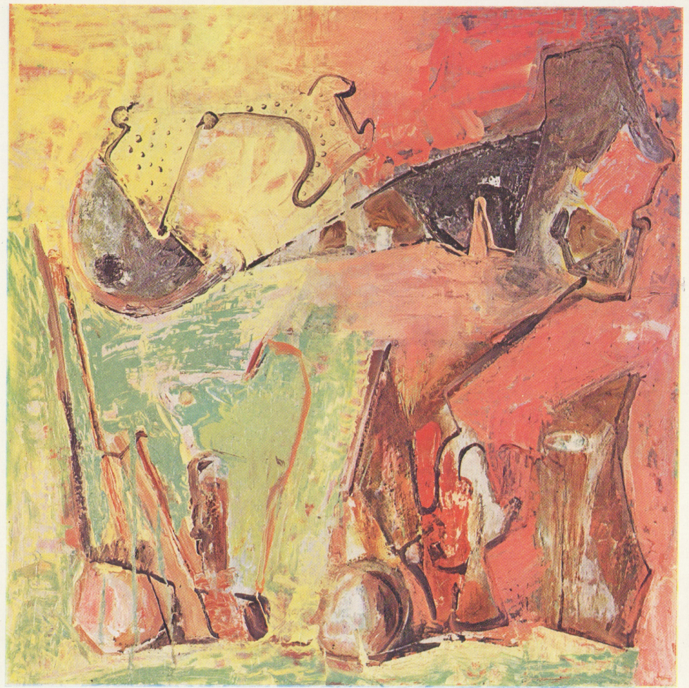
« Interno » olio 1973 cm. 60 x 60