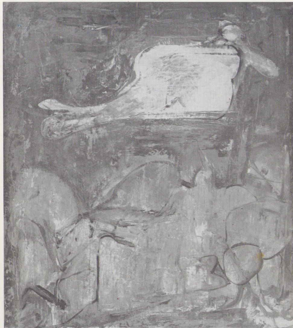
« Interno - Esterno » olio 1973 cm. 55 x 65