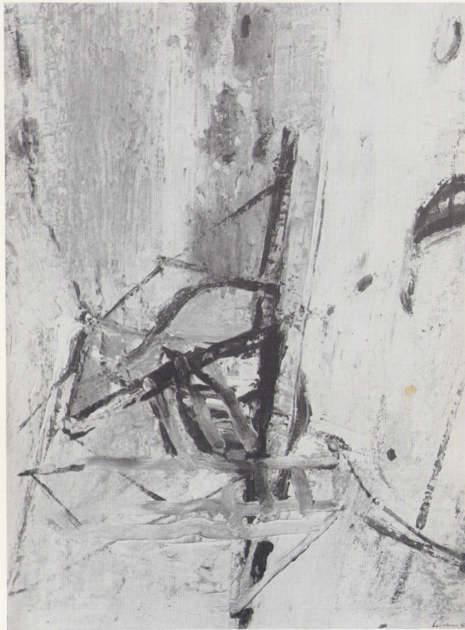
« Interno - Esterno » olio 1972 cm. 50 x 65