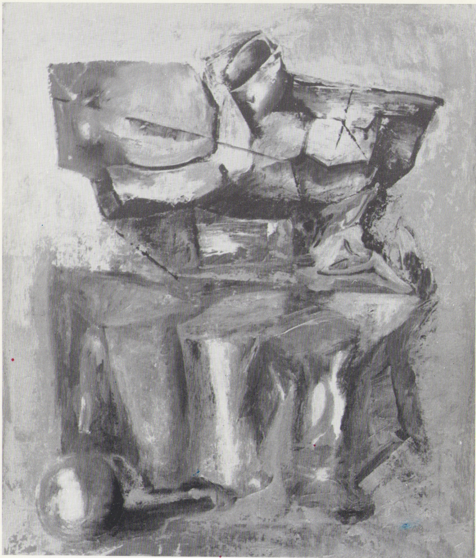
« Contrasto » olio 1973 cm. 50 x 60