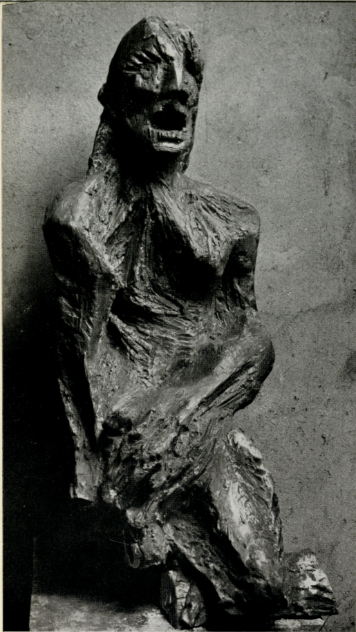
“ Donna „ , 1962 gesso (cm. 100 x 55 x 42)