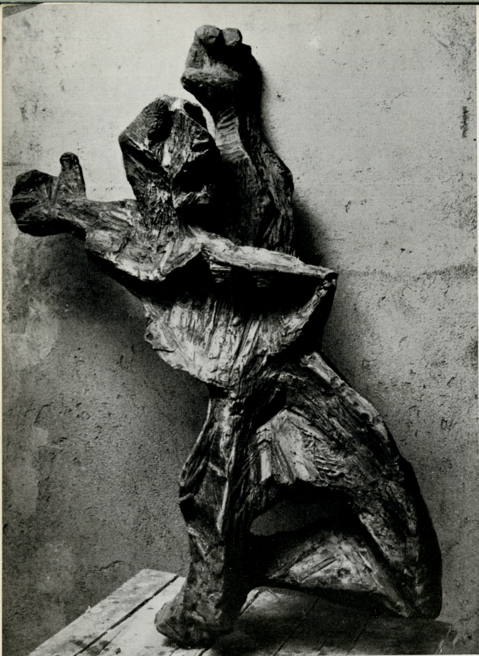
“Fucilato”, 1963 gesso (cm. 120 x 55 x 40)