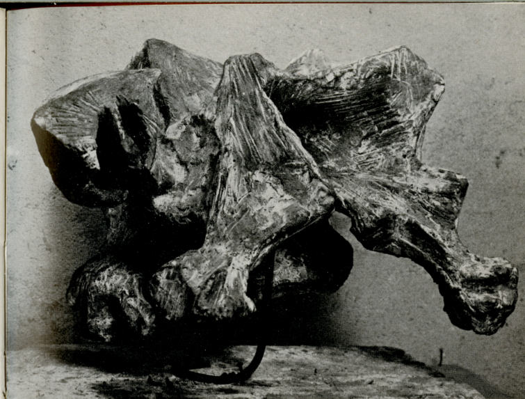
“Gatto”, 1962 bronzo (cm. 32 x 52 x 30)