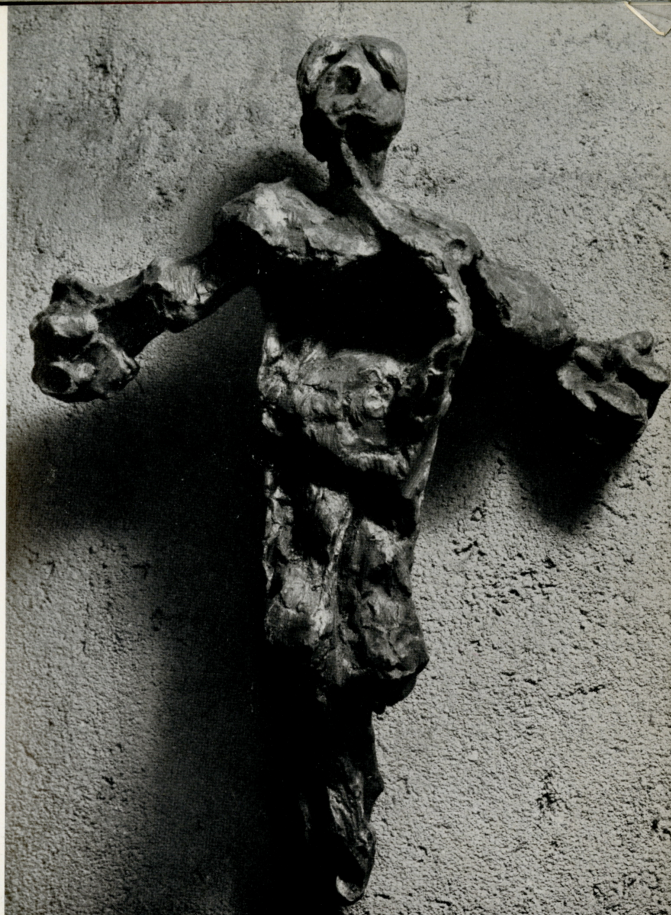
“ Uomo in croce „ , 1963 gesso (cm. 65 x 50 x 15)