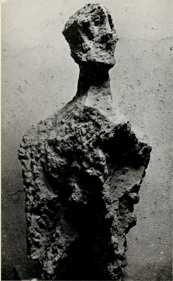
“Uomo”, 1961 pietra (cm. 100 x 50 x 42)