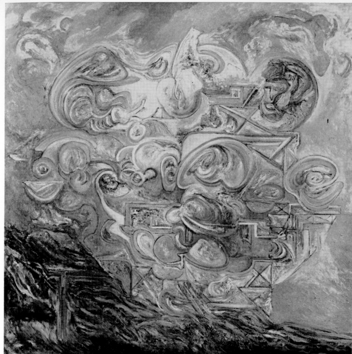
L'isola della mia fantasia 1975 olio cm. 150 x 150