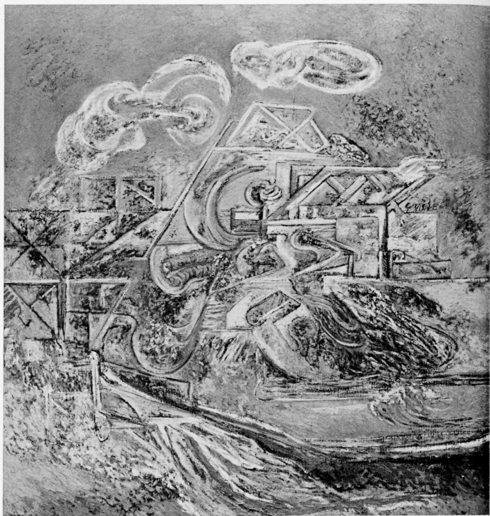
Brianza 1975 olio cm. 130 x 140

Scrivere sul lavoro pittorico di Basile è un'impresa non facile dato il suo temperamento vitalistico e inquieto portato, per esigenze interiori, ad affrontare problemi diversi, espressioni nuove, alcune come prodomi di un successivo sviluppo, altre come momenti labili della sua fervida e tumultuosa immaginazione.