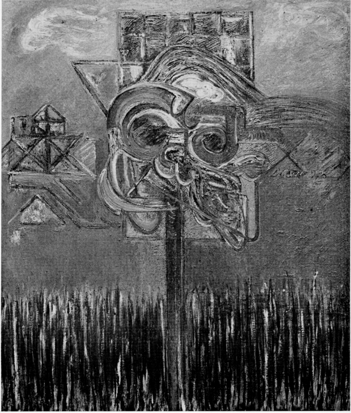
Figura nel paesaggio 1975 olio cm. 110 x 131