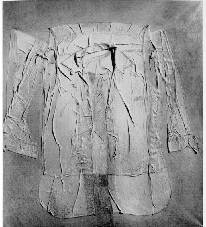
Senza personaggio 1976 olio e collage cm. 100 x 110