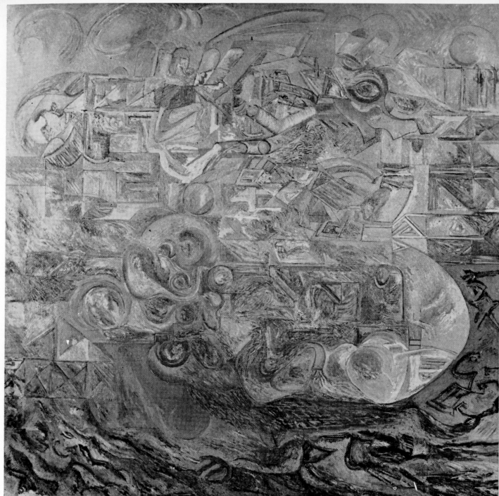
Paesaggio 1975/76 olio cm. 150 x 150