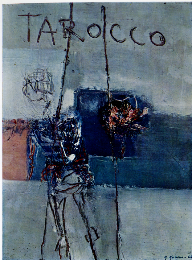
"Tarocco" - 1968 - olio