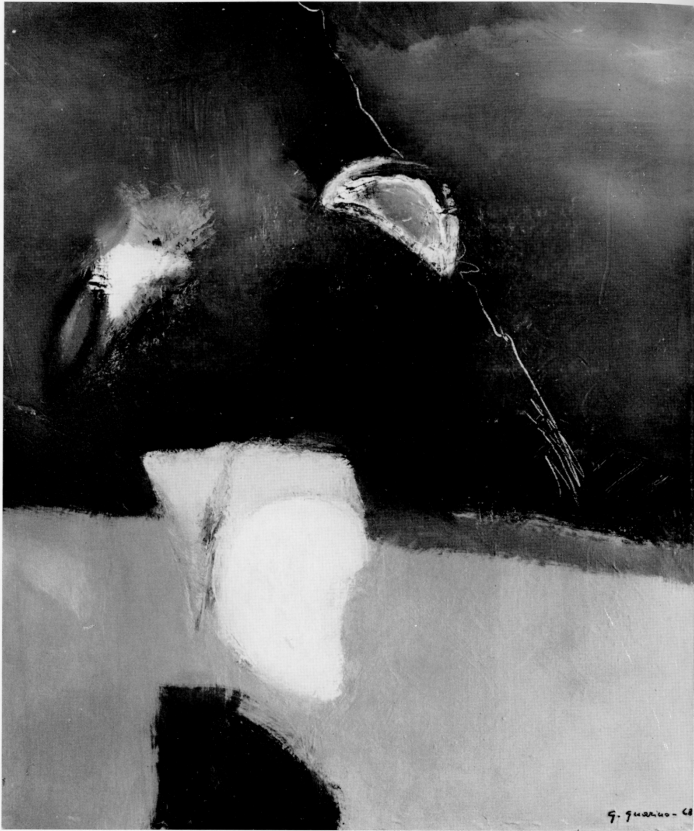
"Notturmo con civetta e arcani" - 1968 - olio