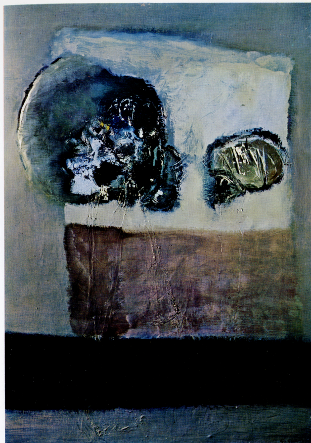
"Paesaggio con finestra, fiori e arcani" - 1968 - olio