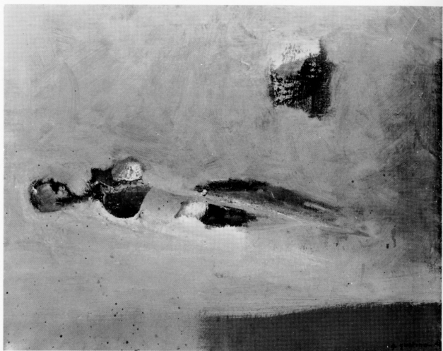
"Il marinaio fenicio" (da T. S. Eliot) - 1968 - olio