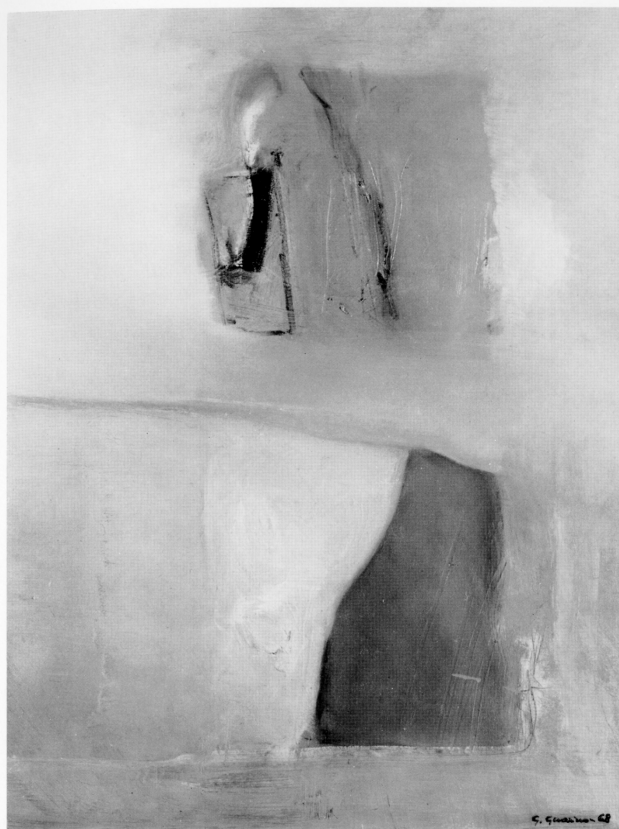
"Paesaggio a mezzaluce con finestra" - 1968 - olio