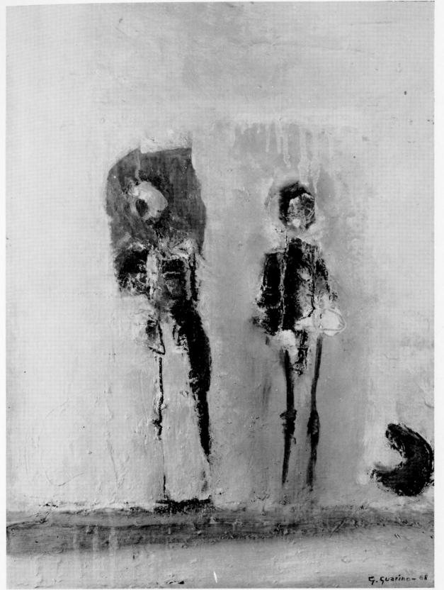
"Personaggi per un epilogo" - 1968 - olio