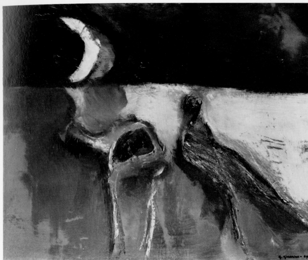
"Paesaggio dopo il diluvio" - 1968 - olio