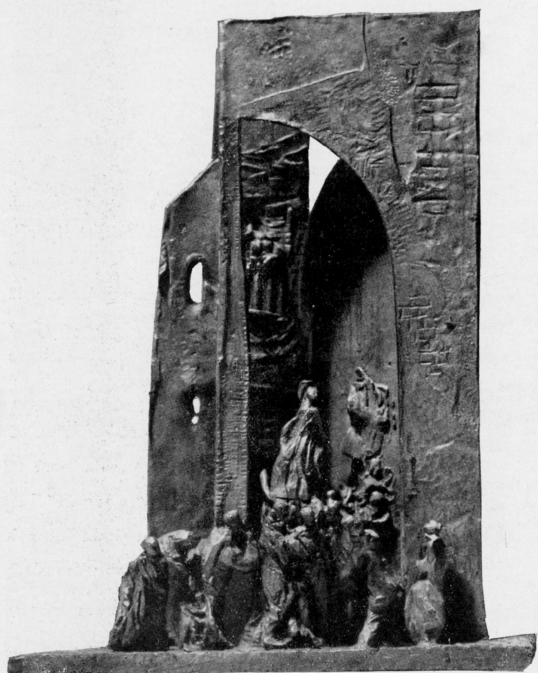
« Processione » - bronzo