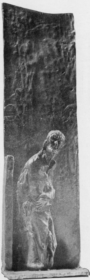
« Mendicante » - bronzo