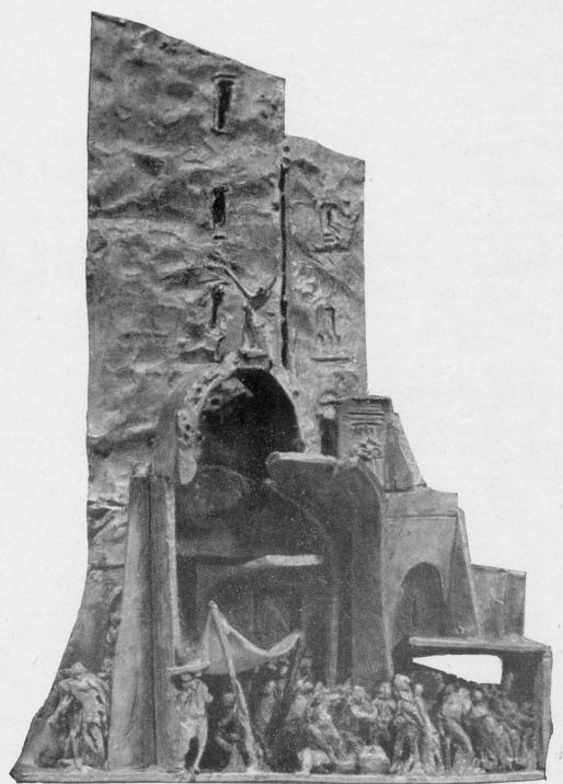
« Mercato » - bronzo

Ogni bronzo è un esemplare unico cesellato dall'autore.