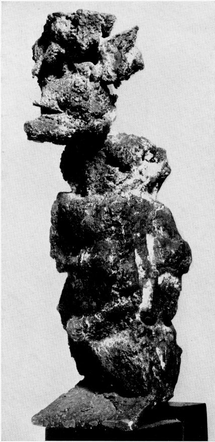
« L'avarò » 1964 - bronzo cm. 20 × 6,5 × 7