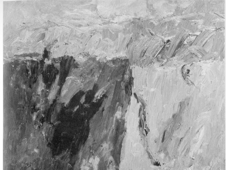
« Paesaggio » olio 1972