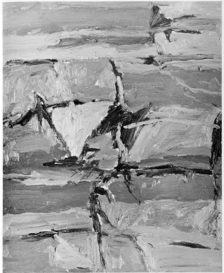
« Paesaggio » olio 1973