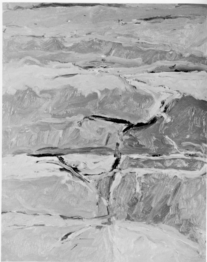
« Paesaggio » olio 1973