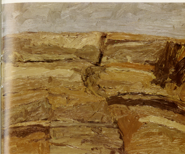
« Paesaggio » olio 1973