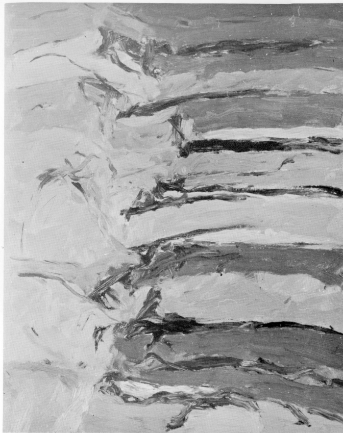
« Paesaggio » olio 1972