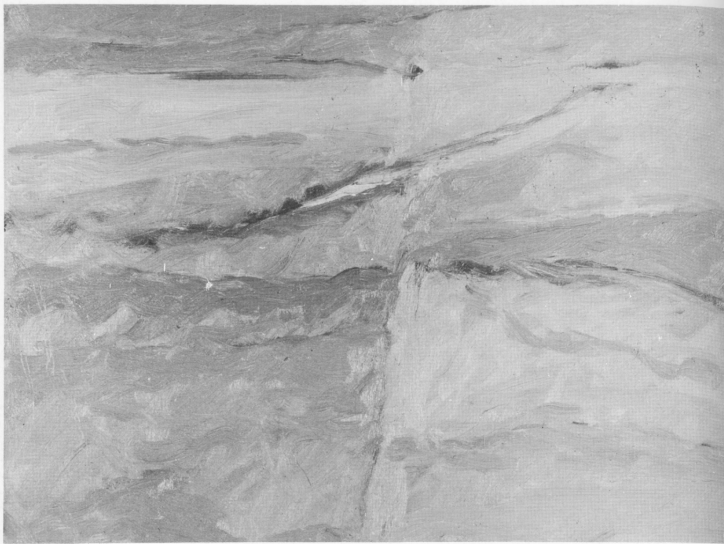
« Paesaggio » olio 1972