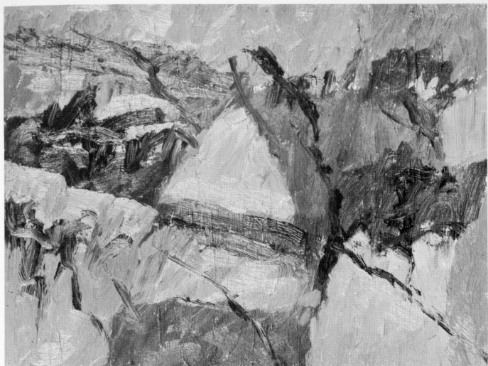
« Paesaggio » olio 1972