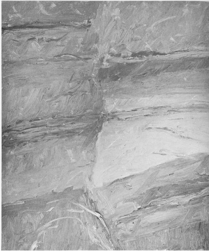
« Paesaggio » olio 1972