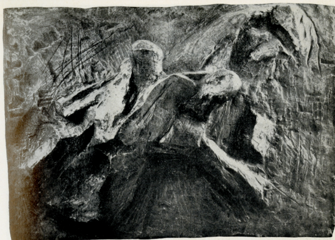
"La Città", 1962 bronzo (cm. 75 x 105)