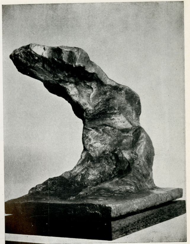
"Madre", 1962 bronzo (cm. 50 x 53 x 33 1/2)