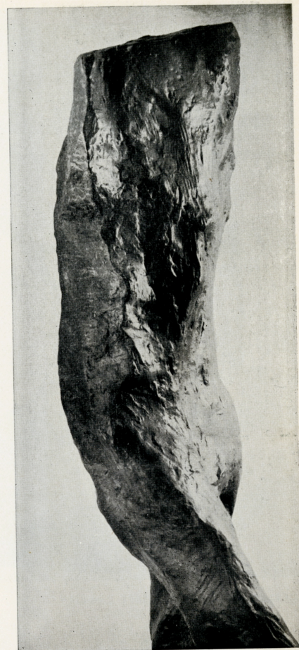
“Benedetta”, 1962 (particolare)