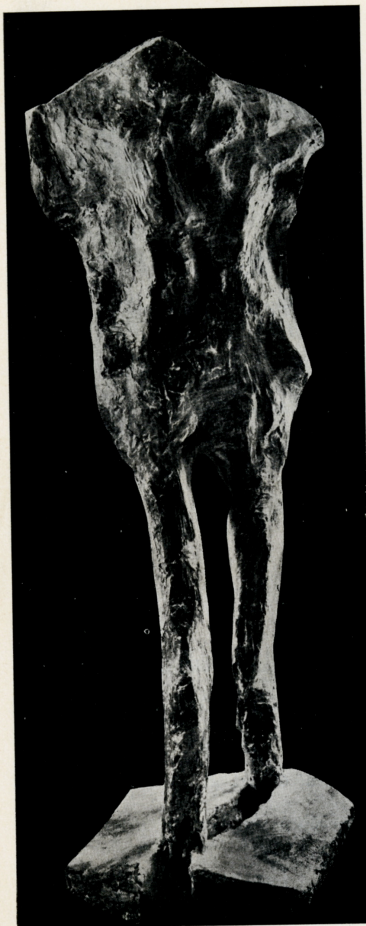
“Benedetta”, 1962 bronzo (cm. 100 x 74 x 85)