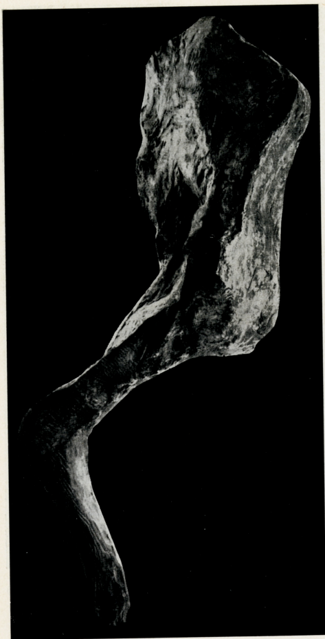
"Benedetta II", gesso (cm. 165 x 50 x 75)