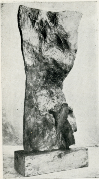
"Radice", 1962 bronzo (cm. 183 x 87 x 56)