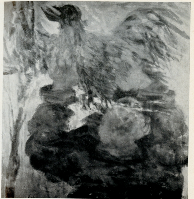
“Preda ferita 2.”, 1960-61