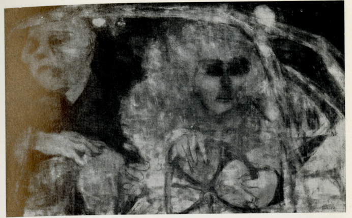
“Cenerentola e il Silver Cloud”, 1962