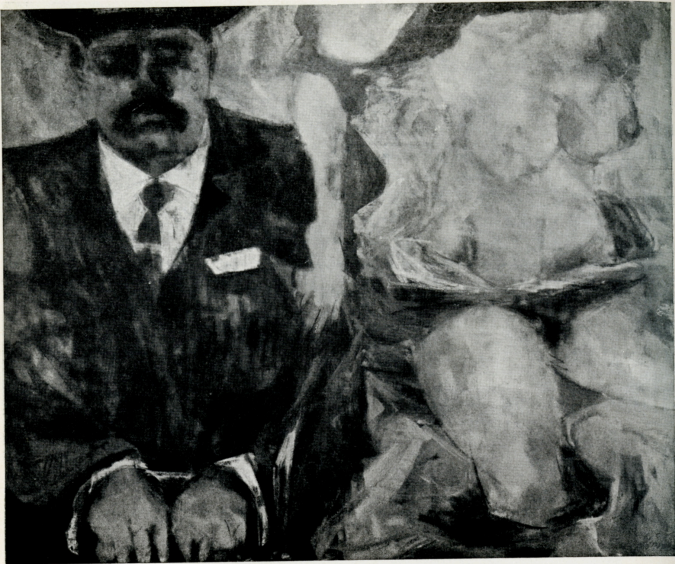
“Monsieur Salan e la bella algerina”, 1962