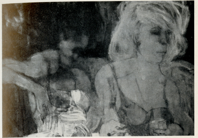
“Passione per il giuoco”, 1962