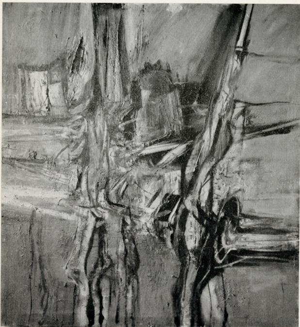
“Vigneto”, 1963 olio