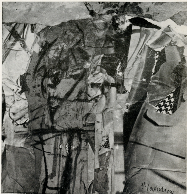
"Paesaggio,, 1963 collage