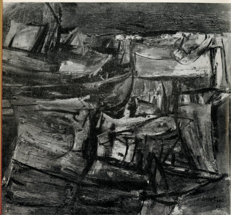
"Paesaggio,, 1963 olio