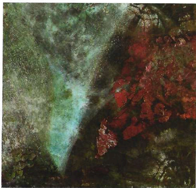
Sogno di una notte di mezza estate 1991 tecnica mista cm 103x107