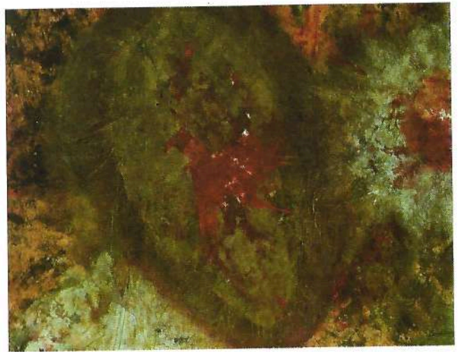
"Al canto del gallo" 1992 tecnica mista cm 125x160