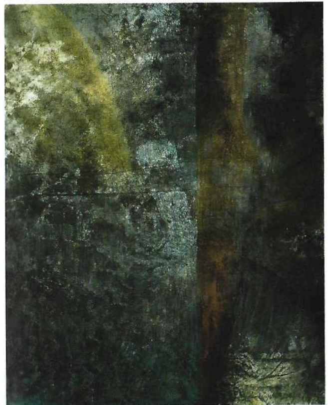
Notturmo 1991 tecnica mista cm 105x82