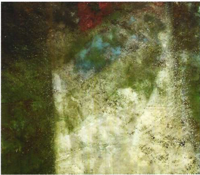
Il lago dei cigni 1991 tecnica mista cm 90x102