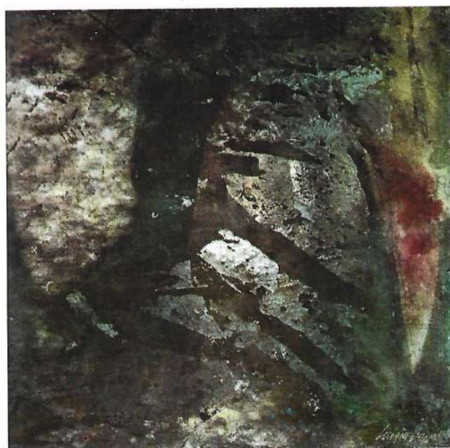
Omaggio a Böcklin 1991 tecnica mista cm 52 x 52