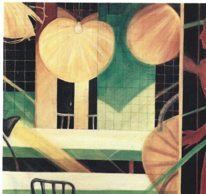
La luce 1989 olio cm. 141 x 153