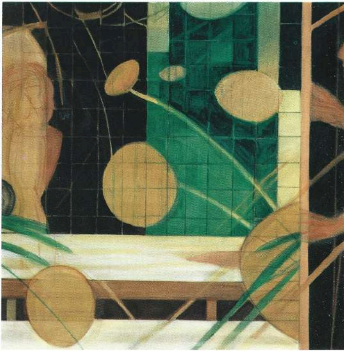
La notte 1990 olio cm. 101 x 101