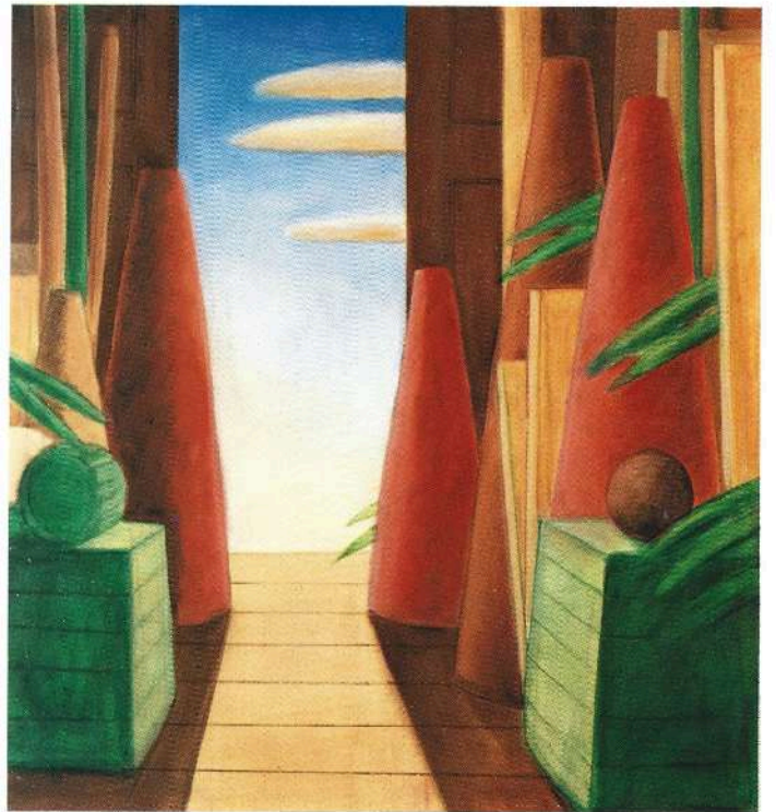
Interno 1988 olio cm. 157×147