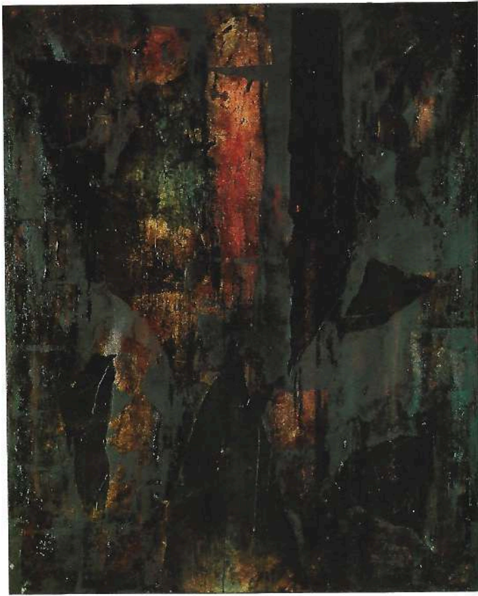
OHNE TITEL COLLAGE AUF LEINWAND 150 X 120 CM