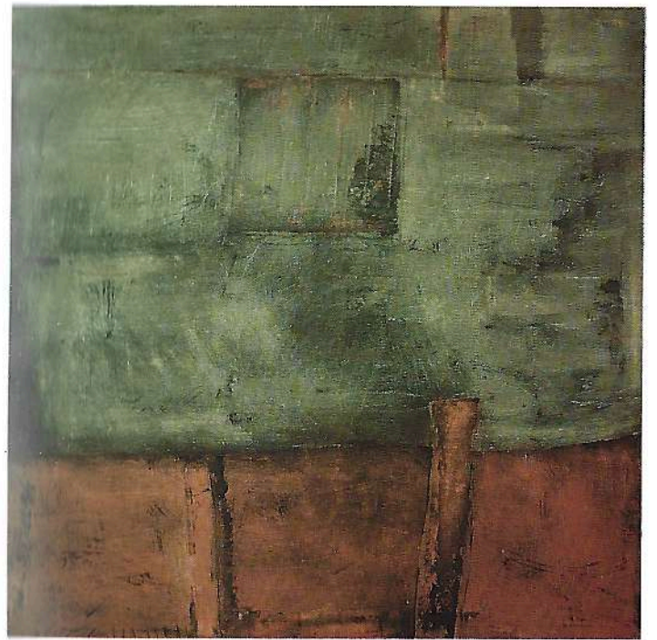
Paesaggio 1990 ossidi cm. 190 x 190