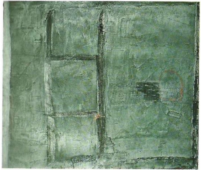
Nostalgia 1990 ossidi cm. 120×140