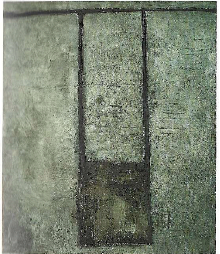
Altalena 1990 ossidi cm. 120 × 100