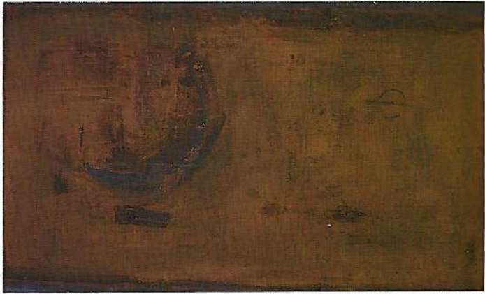
Moonlite serenade 1990 ossidi cm. 60 × 100