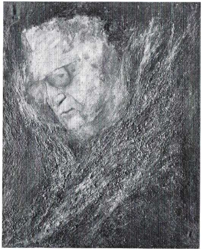
Ritratto 1982 olio cm. 65x82