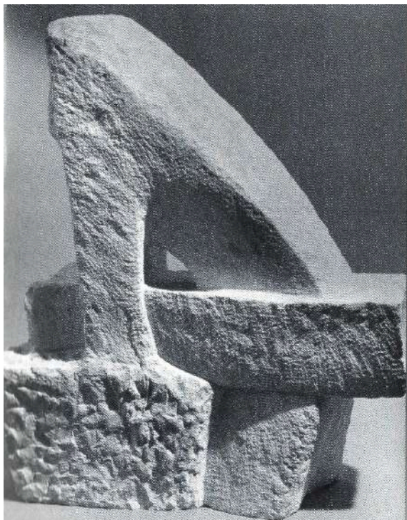
Sopra la terra / Pietra della Turchia - 1990 - cm 58x51x18

Siamo qua ed immaginare non so posto migliore di dove mi sono perso e sto.