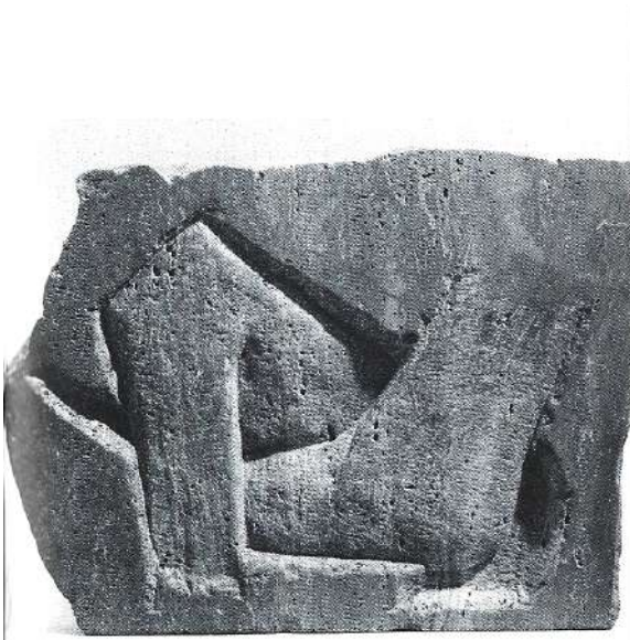
Alcova / Travertino Rosso Persiano - 1990 - cm 45x60x10