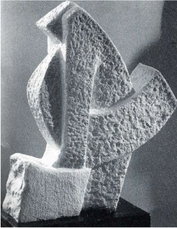
Gotico / Pietra della Turchia - 1990 - cm 80x65x18