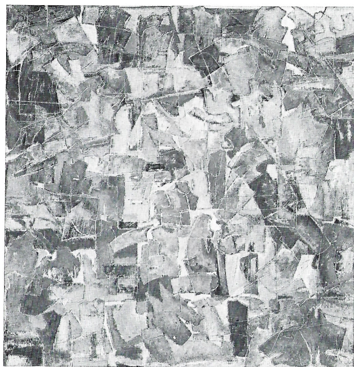
Sartoria 1983 olio cm. 95x95