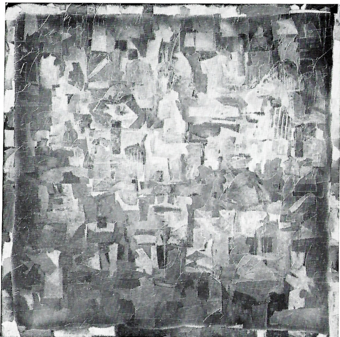
Sartoria 1983 olio cm. 155x155

Giuseppe Basile è nato a Capo d'Orlando nel 1952. Nel 1970 si è diplomato all'Istituto d'Arte di Messina e nel 1975 all'Accademia di Brera. Vive e lavora a Milano.