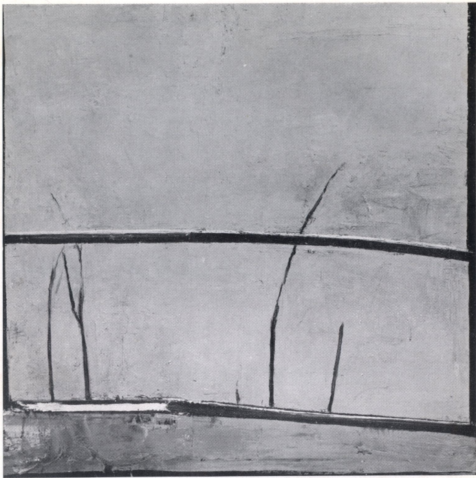
Giuliano Collina "Finestra" 1962