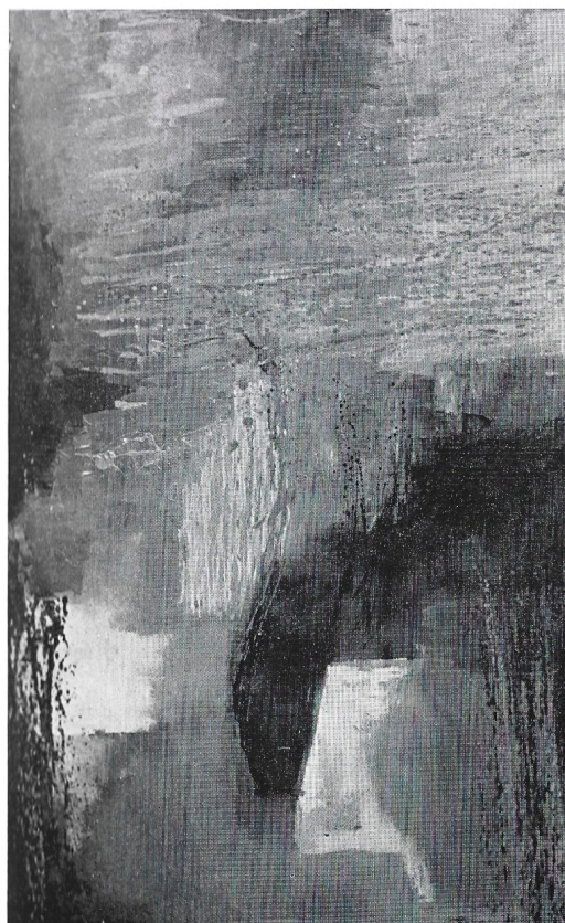
Valle invernale 1982 olio cm. 60x100