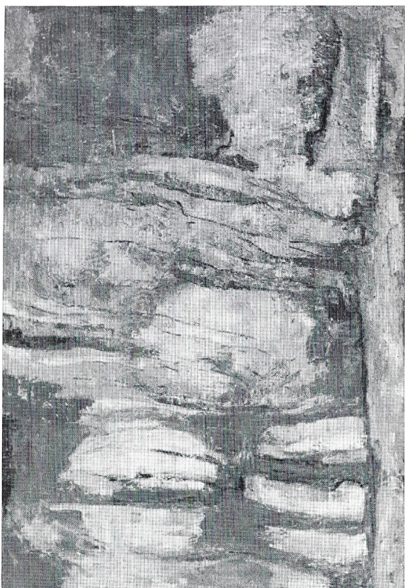
Roccia antropomorfa 1982 olio cm. 110x160