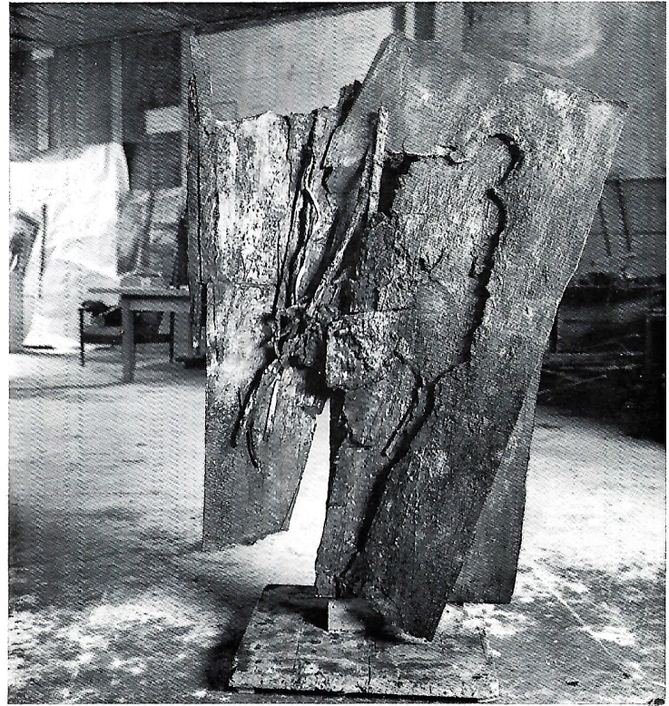
la parete della stanza 1984 bronzo b. cm. 162x114