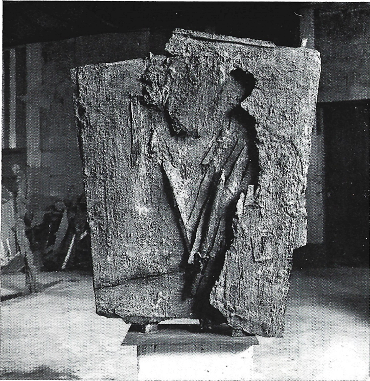
nell'ombra 1984 bronzo h. cm. 100x80