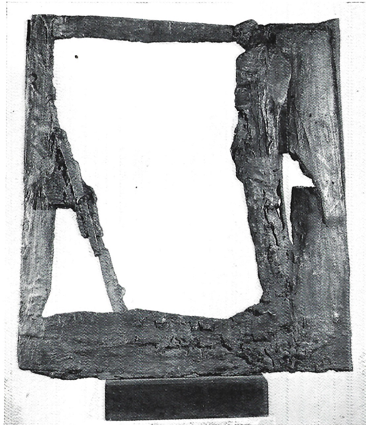
il ritorno 1983 bronzo h. cm. 41x38