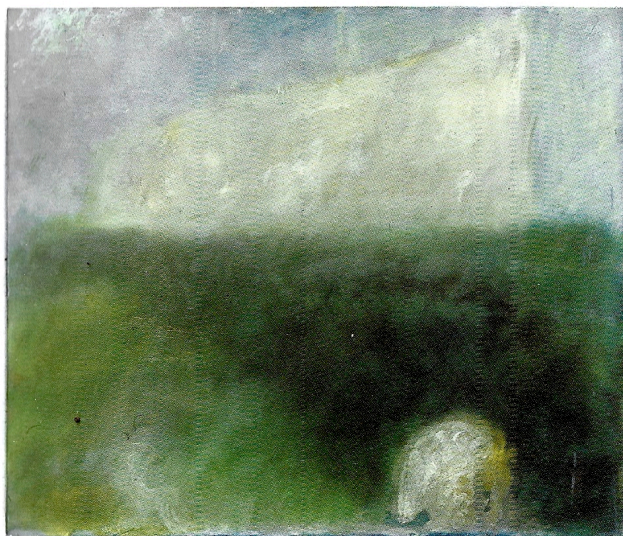
Morte per acqua, 1983, olio su tela, cm 70x60