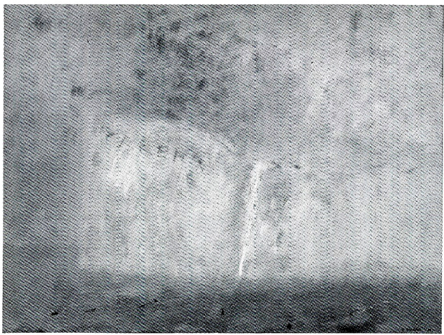
Carena al meriggio, 1983, olio su tela, cm 80×60