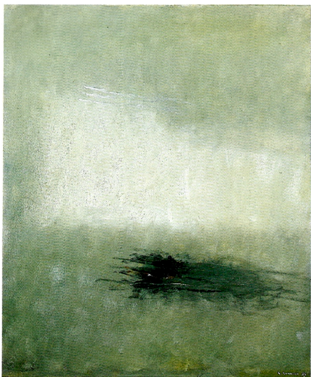
Carena all'alba, 1984, olio su tela, cm 50x60