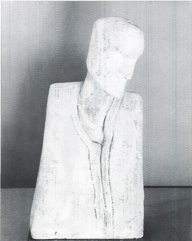
Testa 1987 gesso cm. h. 56×28×21