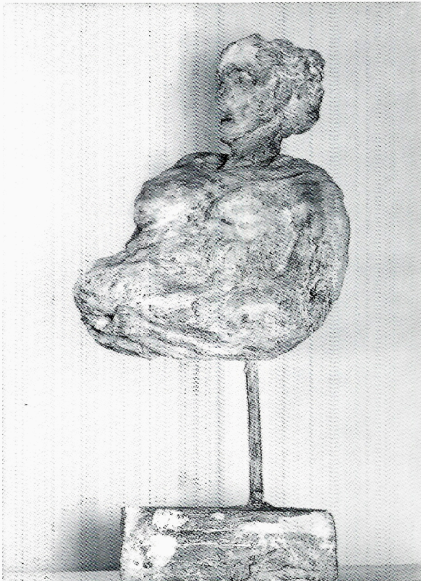
Figura nello specchio 1987 gesso cm. b. 100×48×26