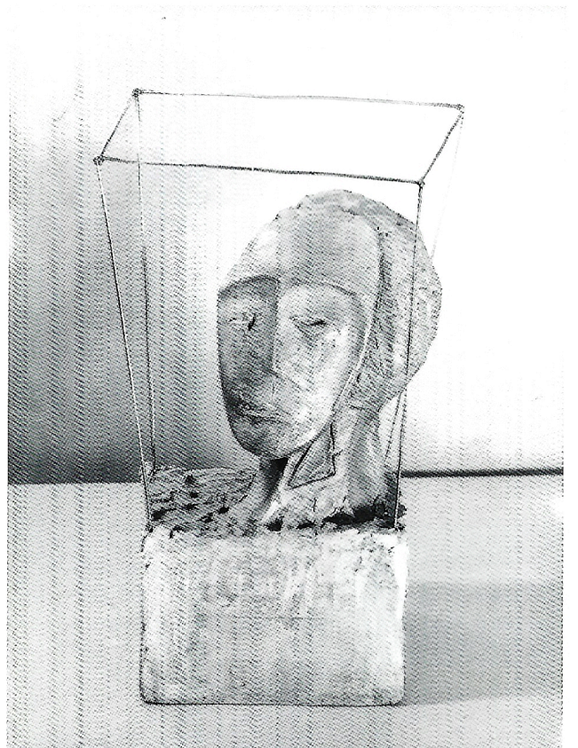
Testa 1987 gesso cm. h. 53×40×19