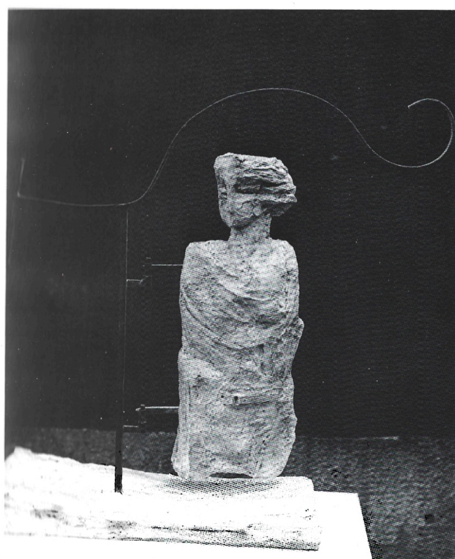
Specchio girevole 1989 gesso-ferro cm. 90×88×25