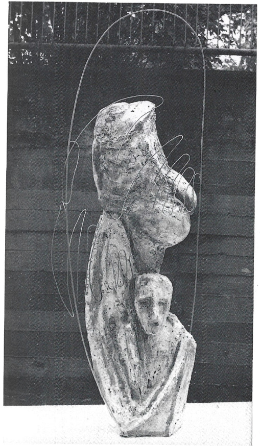
Specchio ovale-riflessi 1990 gesso-ferro cm. 145×50×40