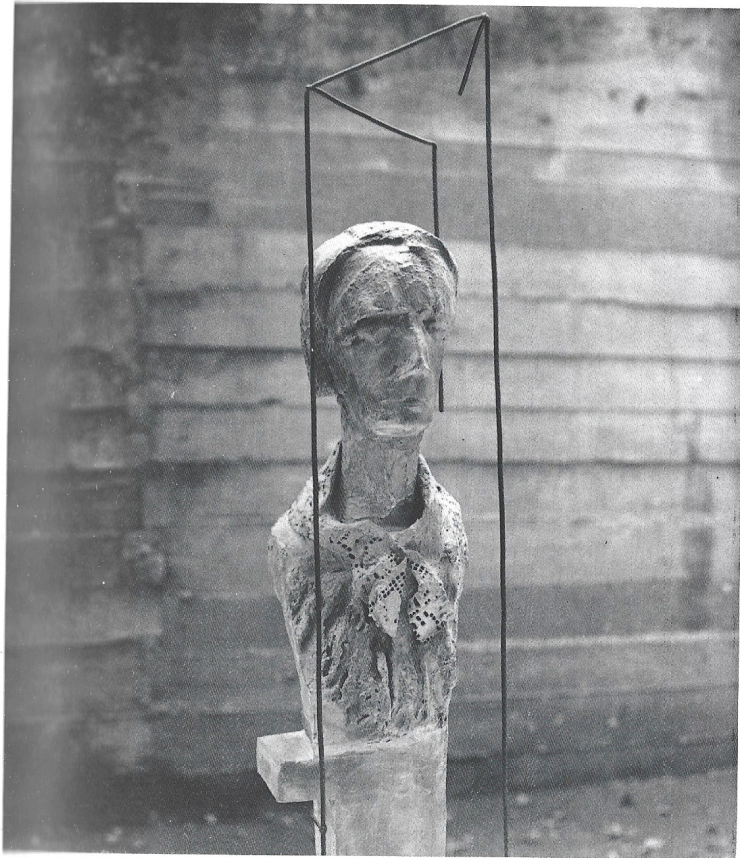
Tela di museo 1989-90 gesso-ferro cm. 96×18×19