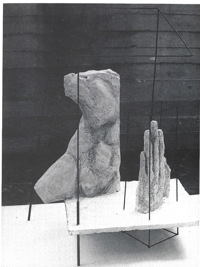
Lezione di antropologia-teca con ritrovamenti 1990 gesso-ferro cm. 92×64×49