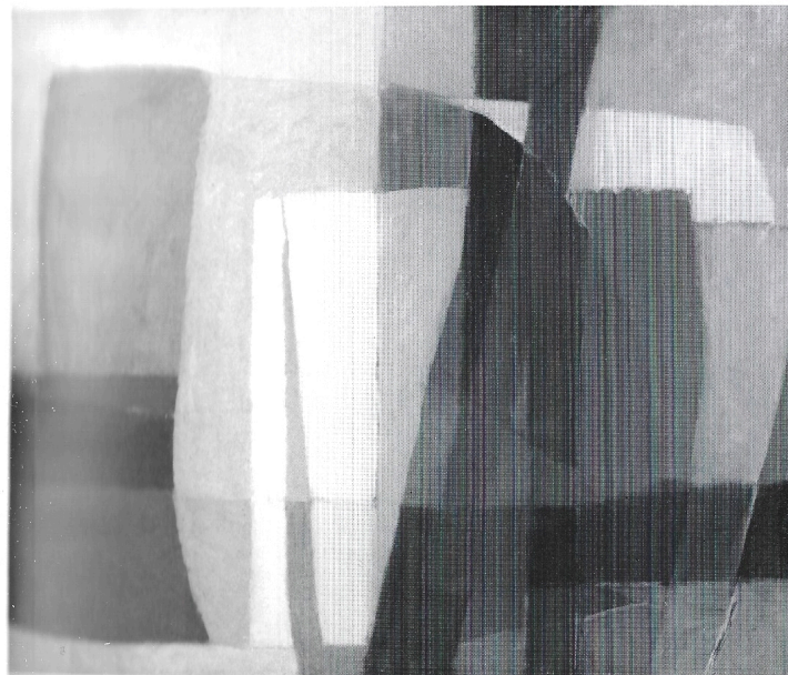
« Suoni trattenuti » 1973 olio cm. 100×80