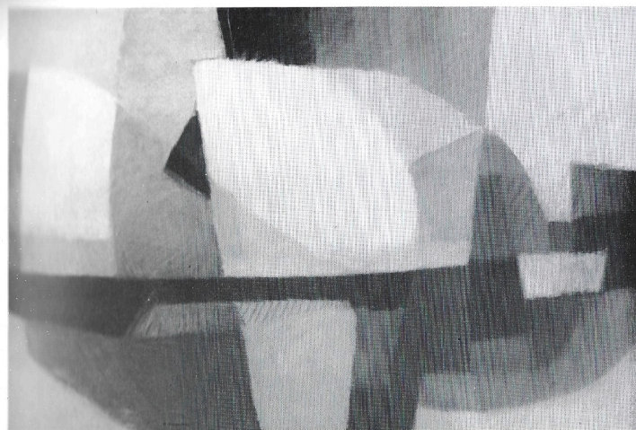
«Canto di crisi e di rottura» 1974 olio cm. 150×100