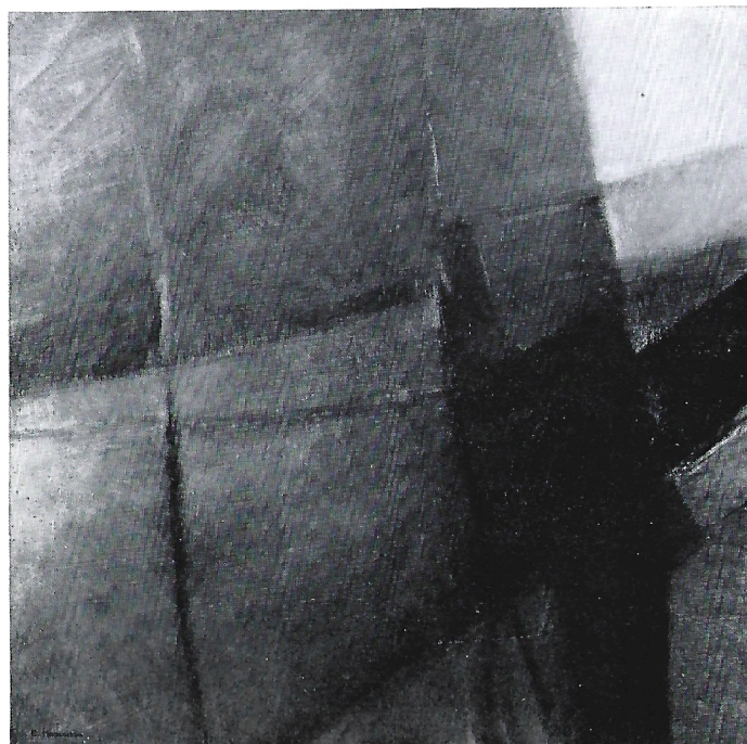
Senza titolo 1983 olio cm. 50x50