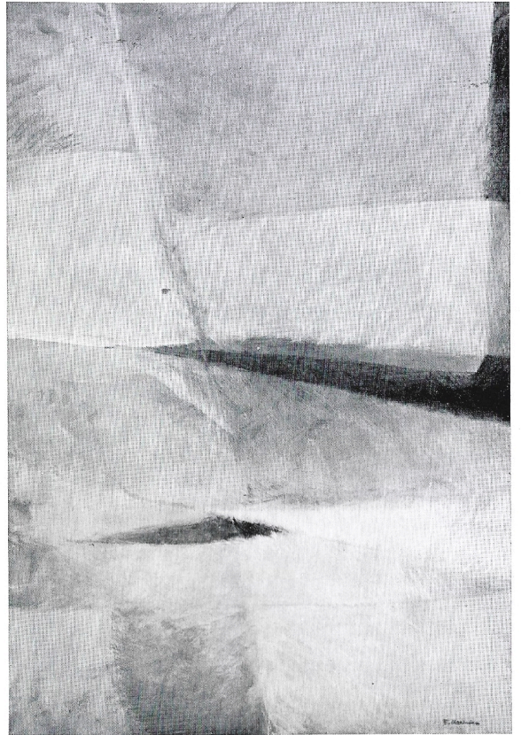
Senza titolo 1982 olio cm. 100x150