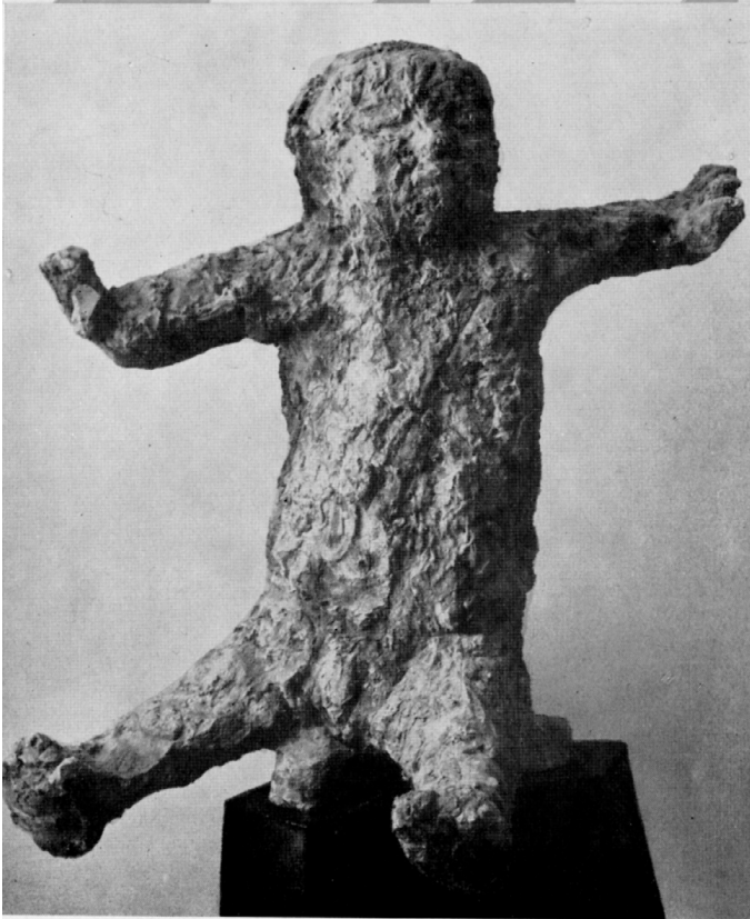
Marta, 1958 Cemento, alt. cm. 110