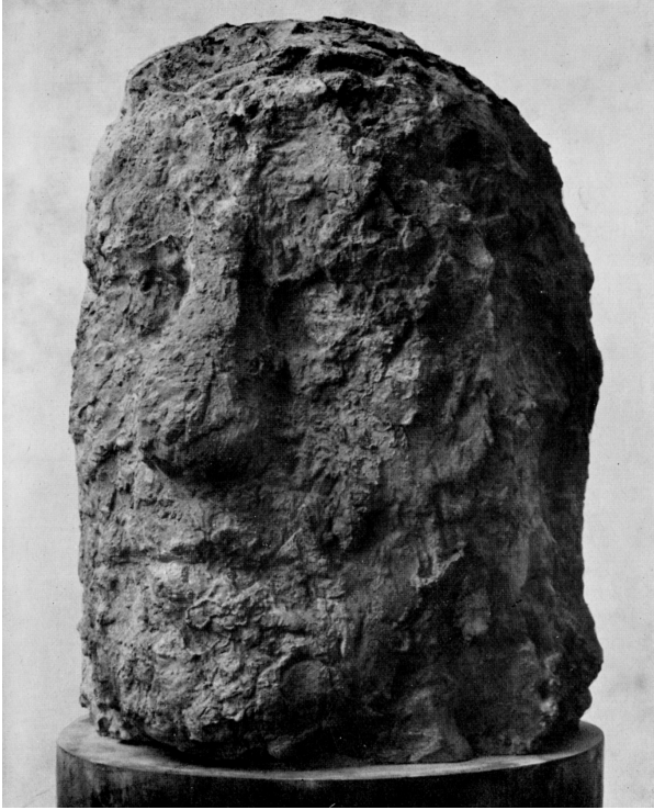
Testa, 1958 Cemento, alt. cm. 62