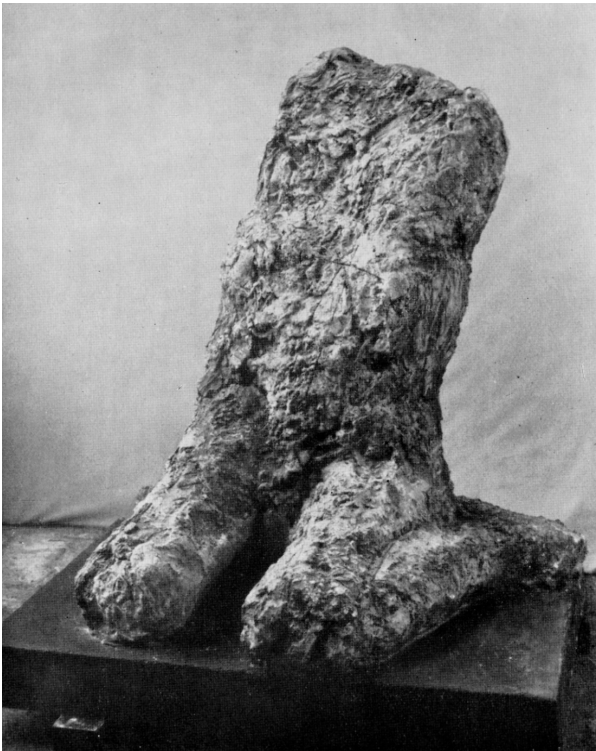
Uomo accosciato, 1959 Gesso, alt. cm. 115