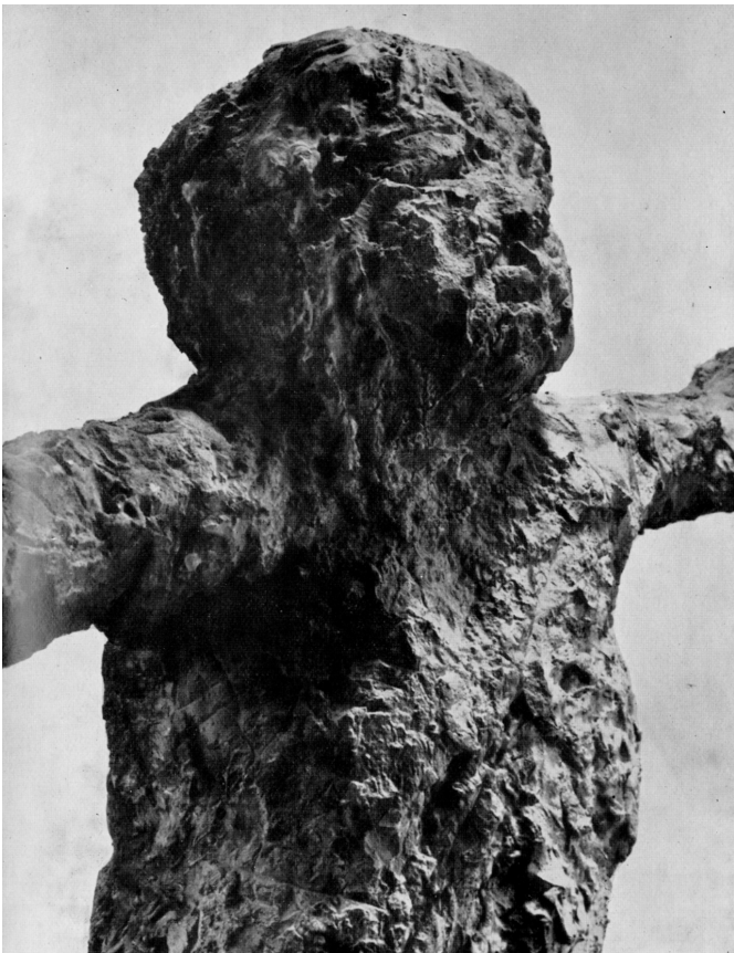
Marta (particolare), 1958 Cemento