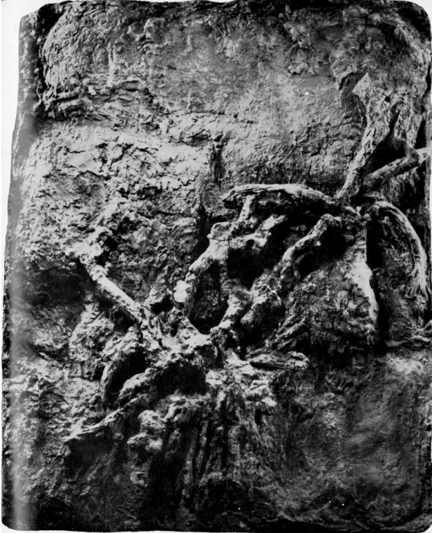
Vecchie mura, 1959 Gesso, cm. 155x130