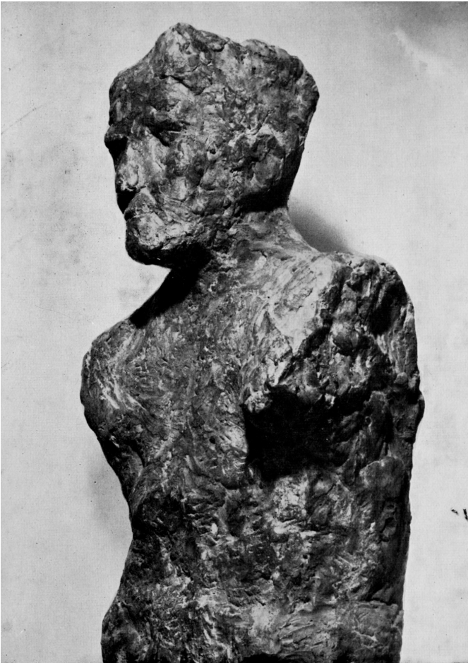
Uomo che cammina, 1958 (particolare) Cemento, alt. 210