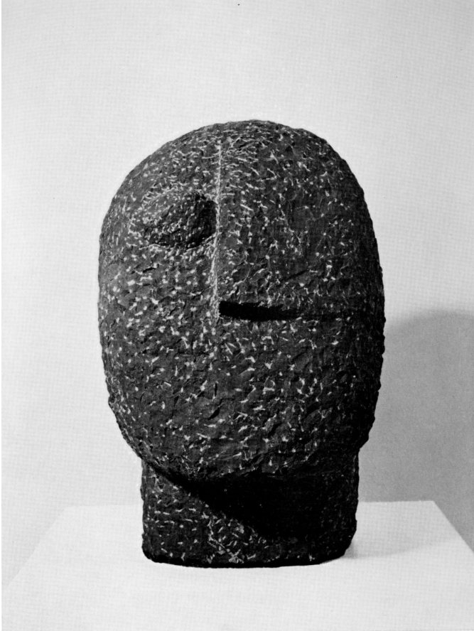
Testa 1975 marmo nero del Belgio h. cm. 40