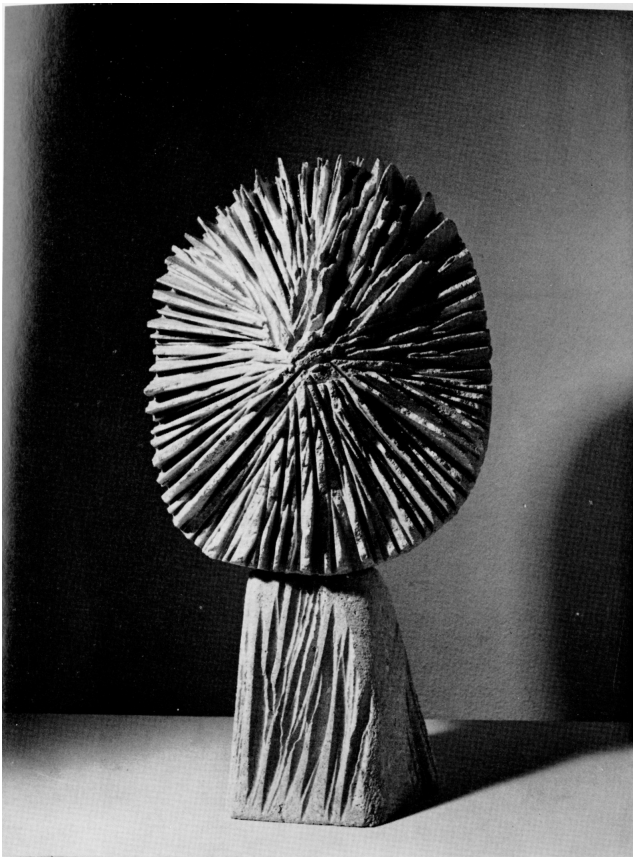
Fleur 1975 pietra di Vicenza h. cm. 45