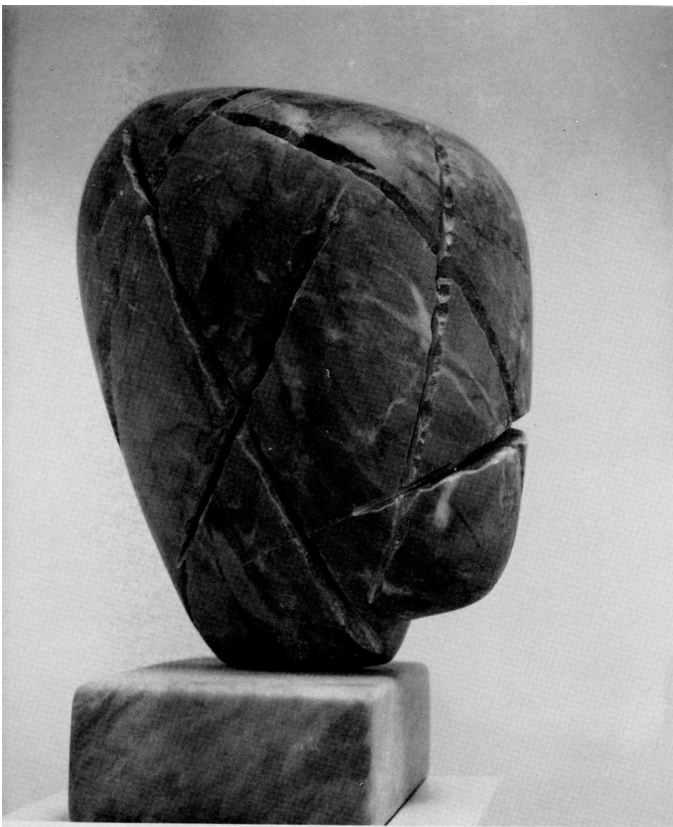
Testa 1974 marmo grigio h. cm. 45