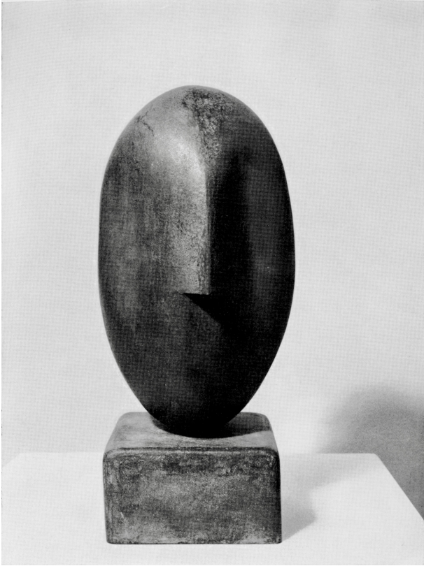
Testa 1975 bronzo b. cm. 37