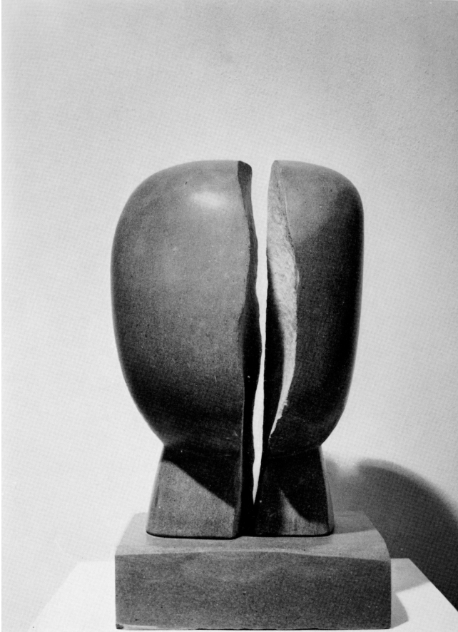
Testa 1973 pietra selena h. cm.