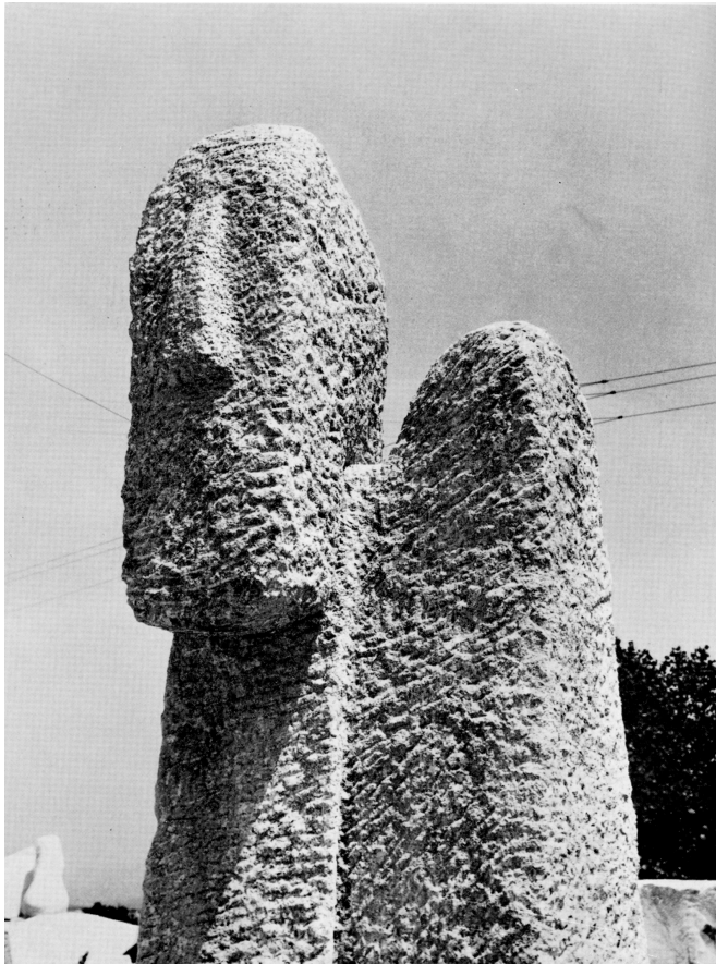
Figura 1973 pietra di Vicenza h. cm. 240