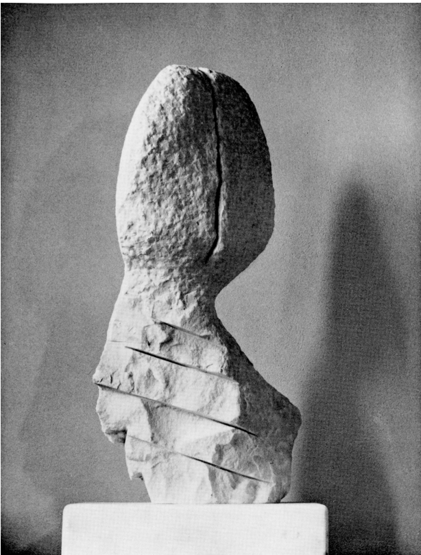
Busto 1976 gesso b. cm. 60