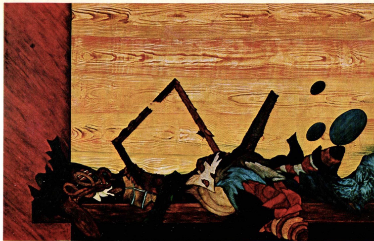
Scaffale olio 1977 cm. 92 x 60

Il « camminare » di Pabi che sembra segnato dal rinnovarsi delle tematiche, che pur si evolvono scanzonatamente e sovente a guisa di ingenuo omaggio a maggiorenti, in realtà è segnato dall'acquisizione di nuovi trucchi lessicali. Dalla memoria e dalla fantasticheria, dal sottosuolo o